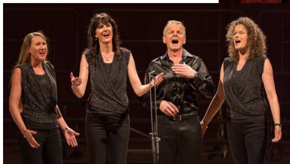
Barbershopgruppe „Klangküsse“