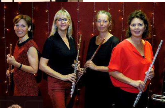
Das Aulos Flötenquartett