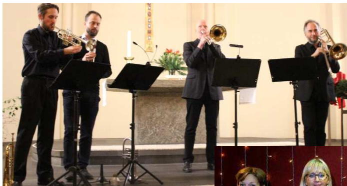
Die Band „Heilig's Blechle“

Im darauffolgenden Jahr hat die Emmaus-Stiftung wieder begonnen, für die eigene Sache kulturelle Veranstaltungen zu planen und durchzuführen. Das heißt, sie hat sich erfolgreich um Zustiftungen und Einnahmen bemüht, um das Stiftungskapital zu erhöhen und natürlich hat sie auch Menschen aus der Gemeinde finanziell unterstützt.